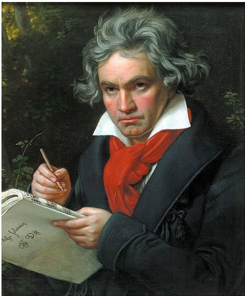
Portrait de Ludwig Van Beethoven (1820) par Joseph Karl Stieler

Elle recouvre par convention la musique composée entre la mort de Johann Sebastian Bach en 1750 et le début de la période romantique, les années 1820. Par extension, la « musique classique » désigne toute la musique savante européenne, de la musique de la Renaissance à la musique contemporaine. Il convient de bien dissocier la musique de style classique, dont les compositeurs phares sont Joseph Haydn, Wolfgang Amadeus Mozart, Ludwig Van Beethoven et Christoph Willibald Gluck, de la musique classique opposée à la musique populaire.