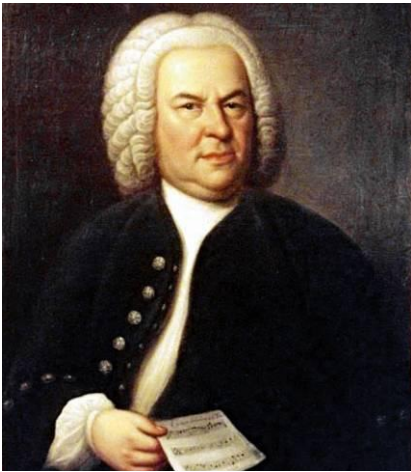
Portrait de Johann Sebastian Bach à 61 ans par E. G. Haussmann

Le baroque couvre une grande période dans l'histoire de la musique, qui s'étend du début du XVII e siècle (création de l'opéra) au milieu du XVIII e siècle, de façon plus ou moins uniforme selon les pays.