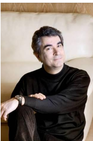
Nicolas Bacri

Bien que toute musique soit par essence contemporaine au moment où elle est créée, quel que soit son style, le terme musique contemporaine est utilisé actuellement pour désigner les différents courants apparus après la fin de la Seconde Guerre mondiale. Certains ont en commun une remise en cause radicale du système tonal établi depuis le XVIII e siècle avec l'émergence de la musique atonale, de la musique sérielle et du dodécaphonisme, d'autres, au contraire, sont revenus à la tonalité mais en allant vers le minimalisme, notamment avec le mouvement de musique répétitive.