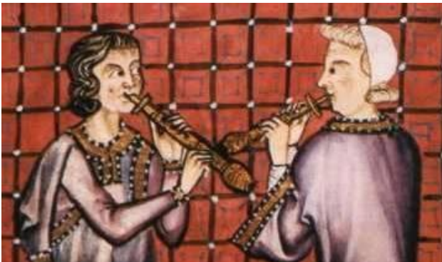
Joueurs de musette, enluminure tirée des Cantigas de Santa Maria