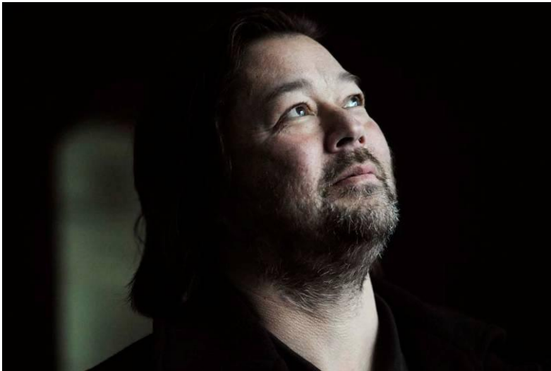
Joseph Swensen, chef d'orchestre

le signal du départ et le tempo de la musique. Il indique également aux musiciens les nuances à suivre (fort, très fort, doucement...).