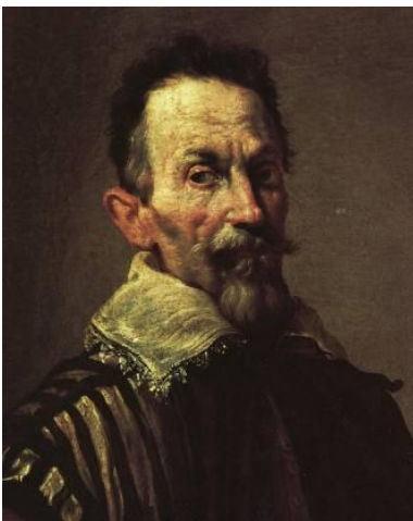
Claudio Monteverdi à Venise, 1640, par Domenico Fetti.

Jusqu'au XV e siècle, la musique n'était qu'un moyen de prière au service de la religion chrétienne. Pour sortir de l'emprise de l'Église, les artistes commencèrent à s'opposer à cette contrainte à partir du XVI e siècle. En opposition avec la musique religieuse, naît la musique profane inspirée des religions païennes. Les XV e et XVI e siècles voient un renouveau d'intérêt pour les cultures grecques et romaines. Les compositeurs de la Renaissance ont voulu opérer un « retour à l'Antique », en imitant la musique des anciens grecs. Comme ils ne disposaient que d'écrits théoriques sur la musique grecque, ils ont élaboré leur propre style en se basant sur ces textes.