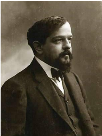
Photographie de Claude Debussy (vers 1908) par Félix Nadar

On désigne souvent par musique moderne la musique composée pendant la première partie du XX e siècle. Cette période n'a pas d'unité de style : elle est au contraire celle de la floraison d'expériences et d'esthétiques diverses, souvent opposées.